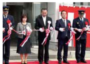
本巣消防署 北方分署 竣工式