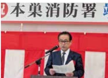
本巣消防署 竣工式

岐阜市、瑞穂市、山県市、本巣市、北方町の消防広域化が進み、地域の皆様の安心・安全を守る新しい拠点のスタートです。